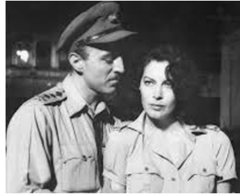
1956 LA CROISÉE DES DESTINS (Bhowani Junction) de George Cukor avec Ava Gardner