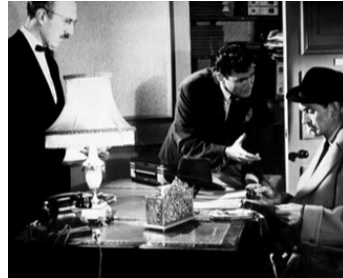
1957 HOUR OF DECISION de C. M. Pennington-Richards avec Carl Bernard