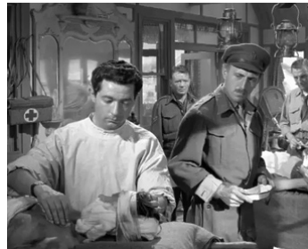
1958 DUNKERQUE (Dunkirk) de Leslie Norman avec Harry Landis