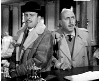
1962 LA POLKA DES POISONS (Kill or Cure) de George Pollock avec Terry-Thomas