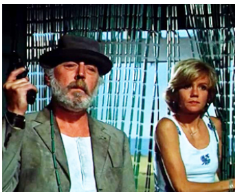
1974 CET EMMERDEUR DE CHARLY (What changed Charley Farthing?) de S. Hayers avec Hayley Mills