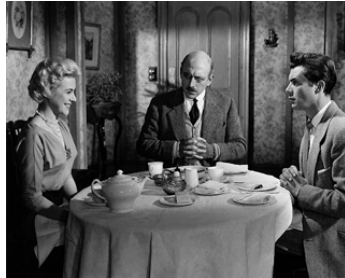
1957 TOUBIB EN LIBERTÉ (Doctor at Large) de Ralph Thomas