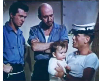
1956 LE BÉBÉ ET LE CUIRASSÉ (The Baby and the Battleship) de Jay Lewis avec John Mills