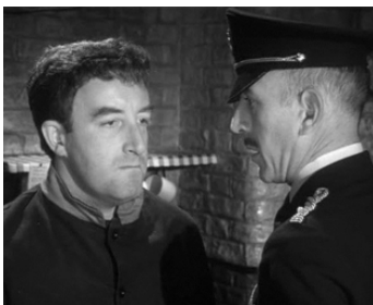
1960 LE PARADIS DES MONTE-EN-L'AIR (Two Way Stretch) de Robert Day avec Peter Sellers