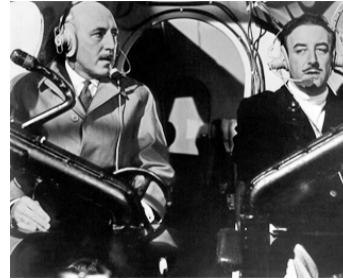
1963 JULES DE LONDRES (The Wrong Arm of the Law) de Cliff Owen avec Peter Sellers