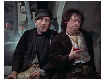
1958 LA REVANCHE DE FRANKENSTEIN de Terence Fisher avec Michael Ripper