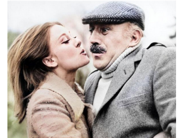
1965 YOU MUST BE JOKING ! de Michael Winner avec Gabriella Licudi