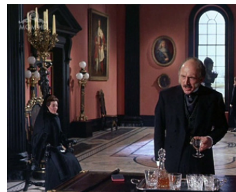
1960 LES PROCÈS D'OSCAR WILDE (The Trials of Oscar Wilde) de Ken Hughes