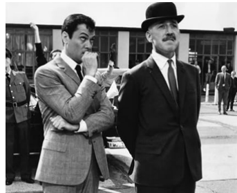
1966 UNE FEMME SUR LES BRAS (Arrivederci Baby) de Ken Hughes avec Tony Curtis