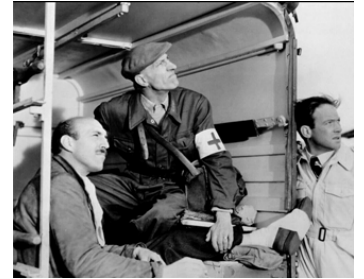
1957 FLAMMES DANS LE CIEL (The Man in the Sky) de Ch. Crichton avec J. Stratton, R. Slater