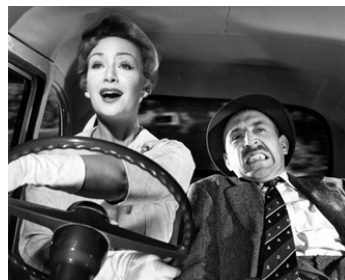
1959 PAGES INDISCRÈTES (Please Turn Over) de Gerald Thomas avec Jean Kent