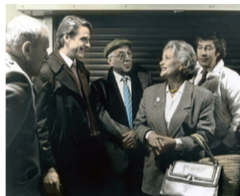
1989 A CHORUS OF DISAPPROVAL de Michael Winner avec A. Hopkins, J. Irons, Sylvia Syms