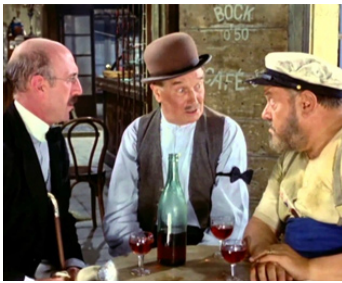
1961 FANNY de Joshua Logan avec Maurice Chevalier, Salvatore Baccaloni