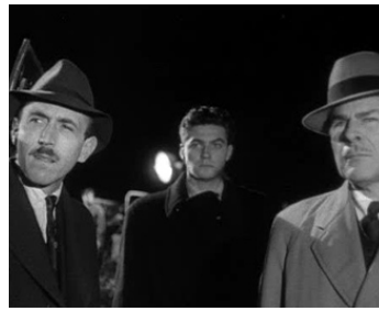
1955 LE MONSTRE (The Quatermain Xperiment) de Val Guest avec M. Kaufman, B. Donlevy