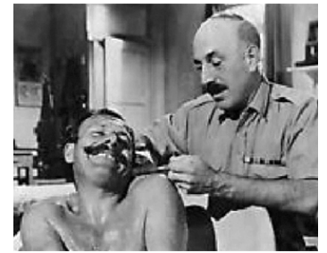
1962 L'AGENT SECRET DE CHURCHILL (Operation Snatch) de Robert Day avec Terry-Thomas