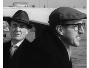
1957 SCOTLAND YARD JOUE ET GAGNE (The Vicious Circle) de Gerald Thomas avec J. Mills