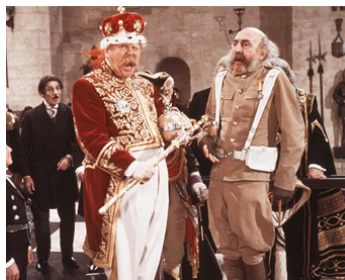
1968 CHITTY CHITTY BANG BANG de Ken Hughes avec Gert Froebe