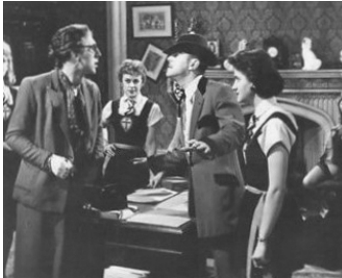
1957 FRIC-FRACS À GOGO (Blue Murder at St. Trinian's) de F. Lauder avec George Cole