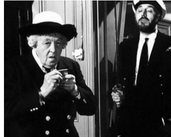
1964 PASSAGE À TABAC (Murder Ahoy) de George Pollock avec Margaret Rutherford