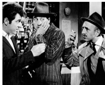
1960 JAZZ BOAT (Jazz Boat) de Ken Hughes avec Anthony Newley, Bernie Winters