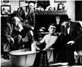
1957 IL ÉTAIT UN PETIT NAVIRE (Barnacle Bill) de Charles Frennd avec V. Maddem, M. Denham