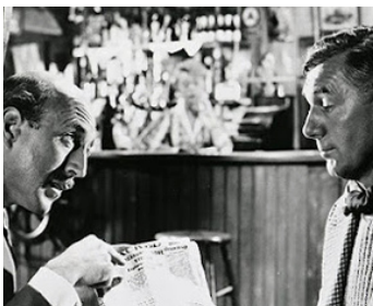
1958 L'HABIT FAIT LE MOINE (Law and Disorder) d'Anthony Asquith avec Michael Redgrave