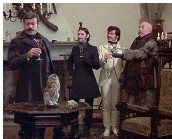
1975 LE FROUSSARD HÉROÏQUE (Royal Flash) de Richard Lester avec Oliver Reed, A. Bates