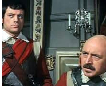
1963 THE SCARLET BLADE de John Gilling avec Oliver Reed