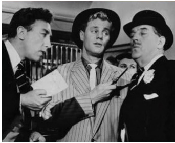
1956 JUMPING FOR JOY de John Paddy Carstairs avec A. E. Matthews