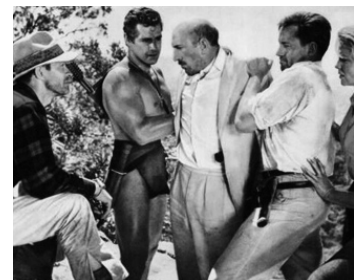
1960 TARZAN LE MAGNIFIQUE (Tarzan the Magnificent) de Robert Day avec J. Mahoney