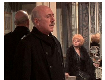
1972 MAIS QUI A TUÉ TANTE ROO? (Whoever slew Auntie Roo?) de C. Harrington avec Sh. Winters