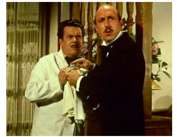
1955 AMOUR ET SKI (All for Mary) de Wendy Toye