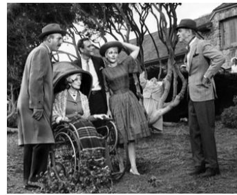
1962 L'INQUIÉTANTE DAME EN NOIR (The Notorious Landlady) de R. Quine avec K. Novak