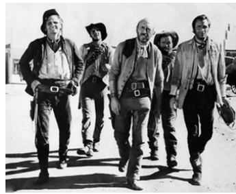
1961 LES DIABLES DU SUD (The Hellions) de Ken Annakin avec Marty Wilde