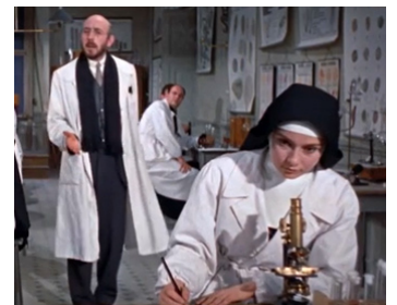
1959 AU RISQUE DE SE PERDRE (The Nun's Story) de Fred Zinnemann avec Audrey Hepburn