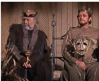
1967 CAMELOT (Camelot) de Joshua Logan avec Richard Harris