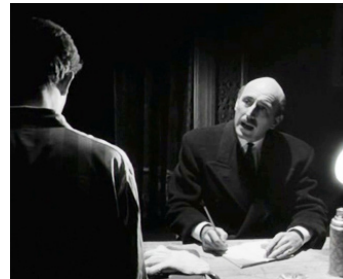
1958 ORDRES DE TUER (Orders to Kill) d'Anthony Asquith