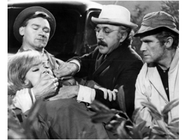
1963 APPELEZ-MOI CHEF (Call me Bwana) de Gordon Douglas avec Edie Adams