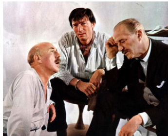
1966 UN MICRO SUR LE NEZ (The Spy with a cold Nose) de D. Petrie avec L. Harvey, E. Portman