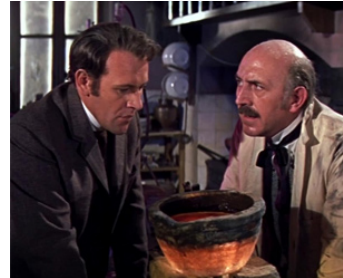
1964 LES PREMIERS HOMMES DANS LA LUNE de Nathan Juran avec Edward Judd