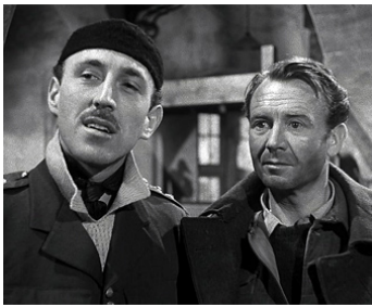
1955 LES INDOMPTABLES DE COLDITZ (The Colditz Story) de G. Hamilton avec John Mills