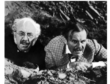
1967 LE GRAND DÉPART VERS LA LUNE (Rocket to the Moon) de Don Sharp avec Terry Thomas